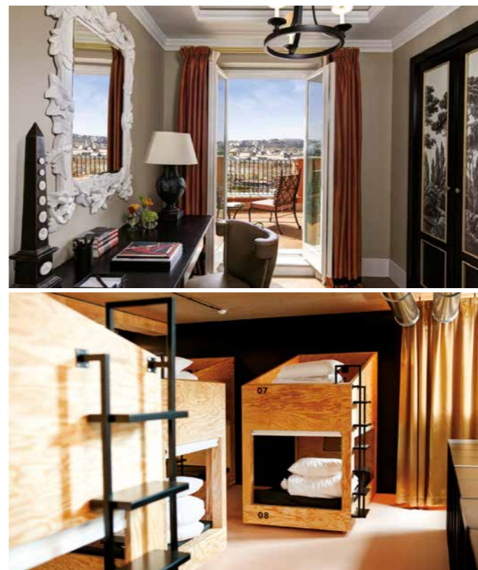
1 | Hôtel de La Ville - Rome, Italie 2 | Hôtel Jo&Joe - Gentilly, France 3 | Hôtel Panorama Nha Trang - Vietnam

Gestion et exécution de projets Conception technique pluridisciplinaire Conception technique spécialisée dans le développement durable et dans la gestion de projets environnementaux Suivi des travaux Économie des projets Gestion des contrats Mandataire ou délégué du maître d'ouvrage Appels d'offres Ordonnancement, pilotage et coordination Désamiantage et déconstruction Assistance à la maîtrise d'ouvrage BIM (Building Information Model)