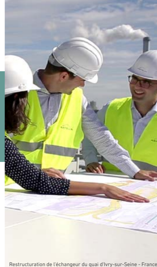
Restructuration de l'échangeur du quai d'Ivry-sur-Seine - France

Patronace musí být řádně zaúčtovány ve výkazech dotčené společnosti skupiny a nahlášeny referentům pro etiku a integritu jmenovaným v rámci skupiny a obchodní jednotky.