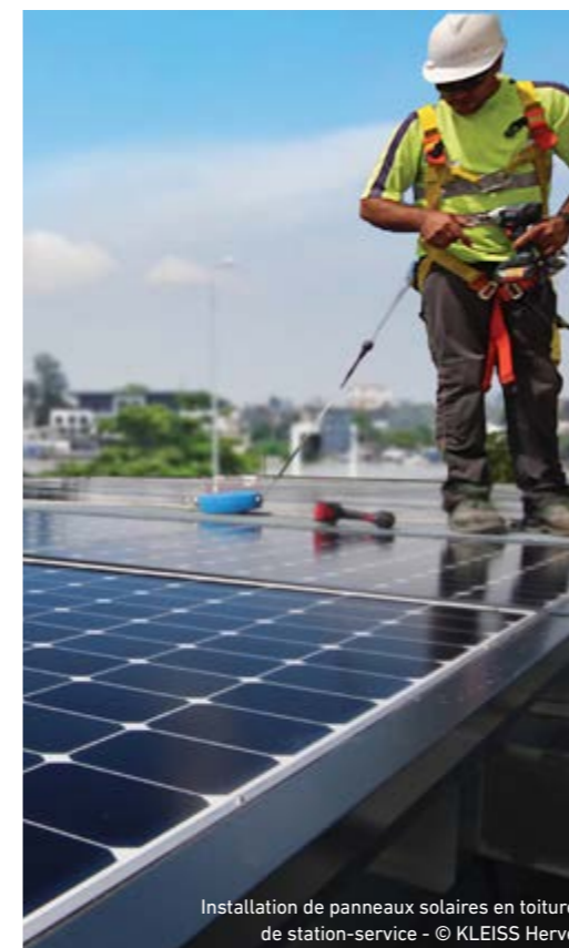
Installation de panneaux solaires en toiture de station-service

Artelia se rovněž domnívá, že obchodní přístupy musí být v souladu se zásadou spravedlivé hospodářské soutěže, a zakazuje jakékoli dohody nebo chování, které by mohlo být popsáno jako praktiky narušování hospodářské soutěže.