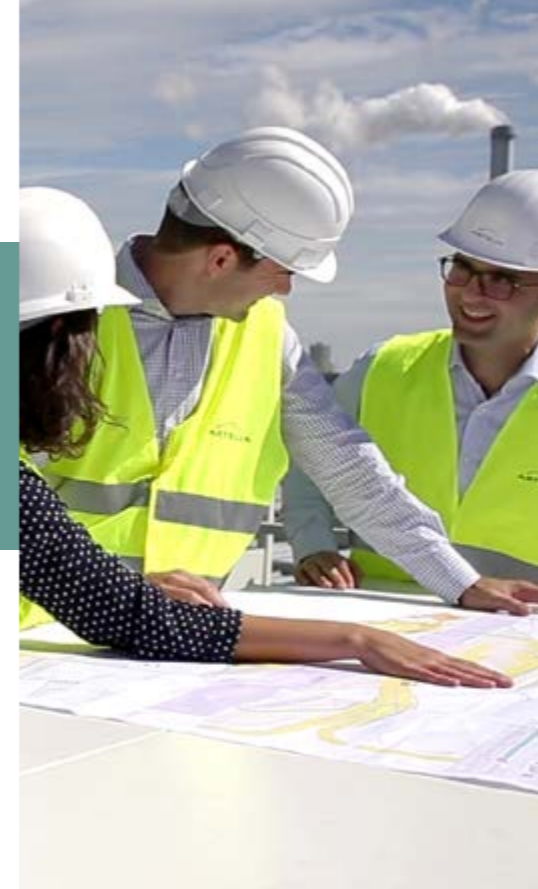
Reestructuración del intercambiador quai d'Ivry-sur-Seine - Francia

Las acciones de mecenazgo deben registrarse en las cuentas de la empresa del Grupo en cuestión y comunicarse a los responsables de ética e integridad del Grupo y de la unidad de negocio.