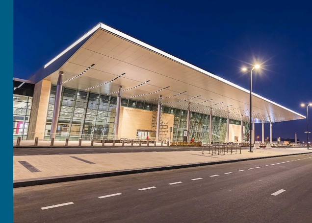
Aéroport de Bahrain Airport, Royaume de Bahreïn Réalisation de nouveaux terminaux, portes avions, routes, parkings, tri-bagages et station pompiers