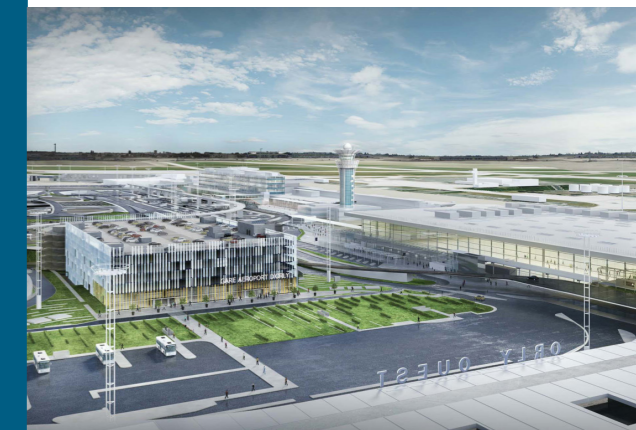
Aéroport d'Orly, France Conception de la station de métro du Grand Paris, terminaux et infrastructures