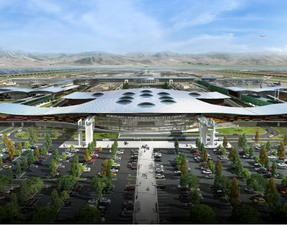
Aéroport de Santiago, Chili Plan Masse et conception d'un nouveau terminal