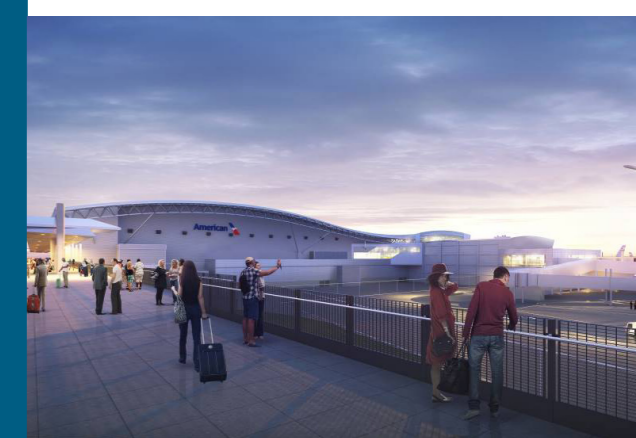
Aéroport JFK de New York, Amérique du Nord Extension du terminal 8