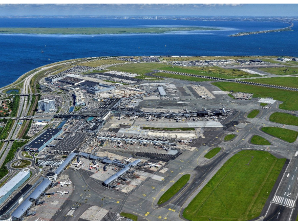
Aéroport de Copenhague, Danemark Conception d'aménagements pour améliorer les flux et l'accueil des passagers