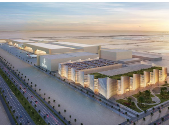
Aéroport de Dubaï - Al Maktoum, EAU Conception de 8 hangars de maintenance (MRO) et de 3 hangars de peinture