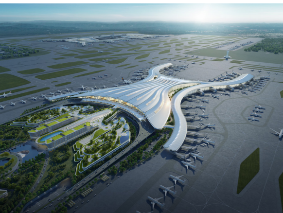
Aéroport de Canton - Baiyun, Chine Conception du terminal 3